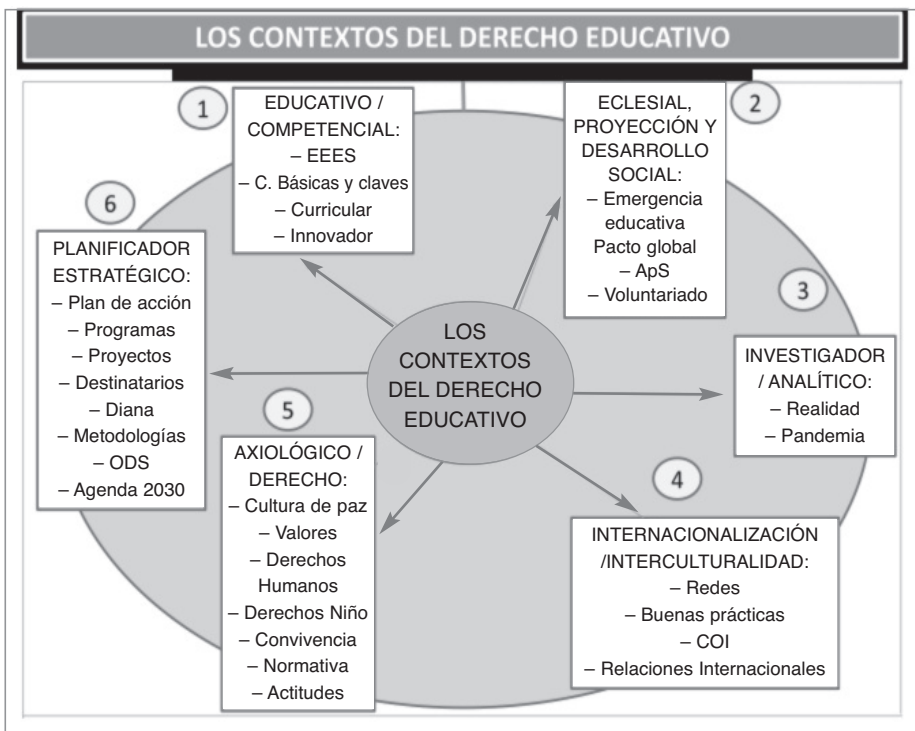
Figura 1 Los contextos del Derecho Educativo

Conocer estos contextos, nos permitirá destacar la importancia del mensaje, de la planificación y sus elementos, de los destinatarios, del medio, de la escuela y la ciudadanía, de las necesidades y la diversidad, para promover con voluntad el Derecho Educativo, tan inminente como necesario.