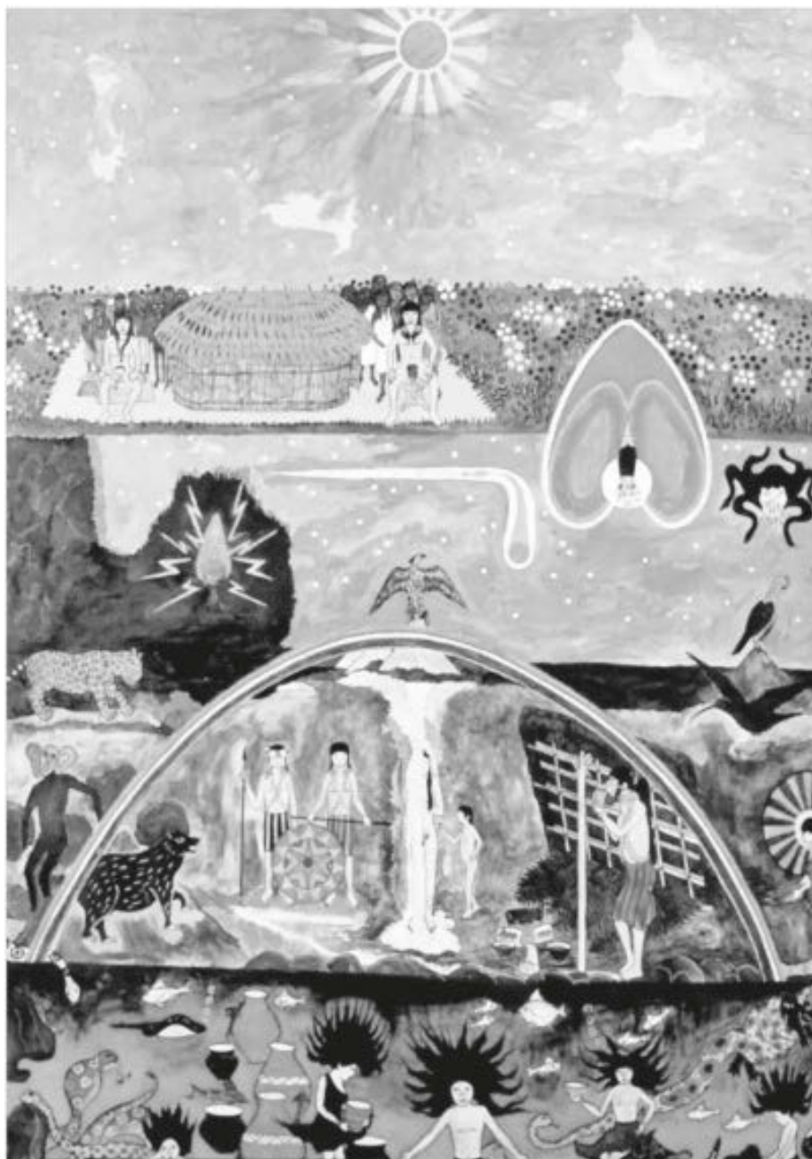
Figura 2 Fotografía Axis Mundi

Nota. AIDSESEP, y Fundación Telefónica, El ojo verde . Cosmovisiones amazónicas, 2000.