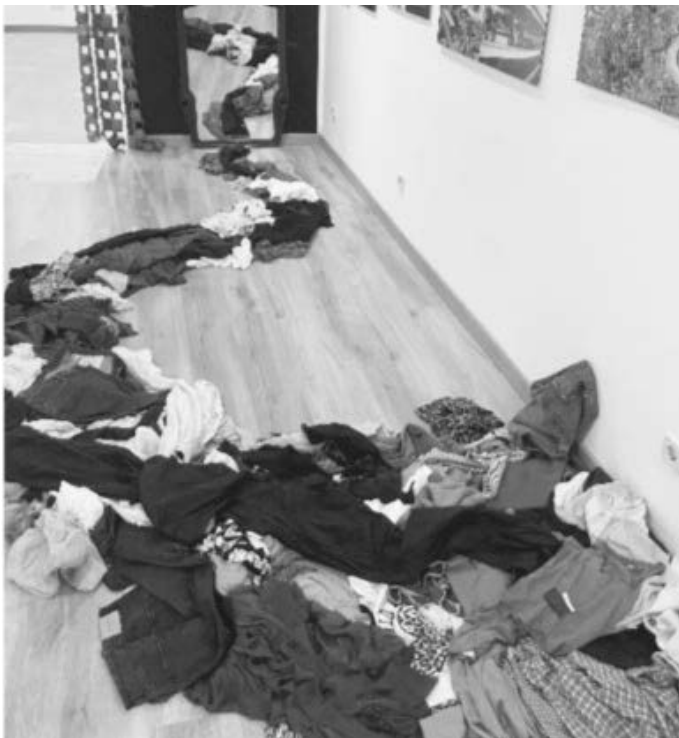
Fotografía Iniciativa artística Museo MS